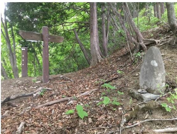
風張峠と馬頭観音(標高1,146m)